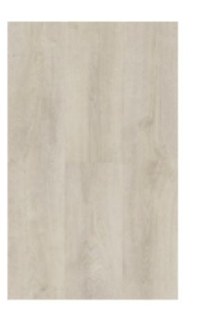
Serene Oak Cream