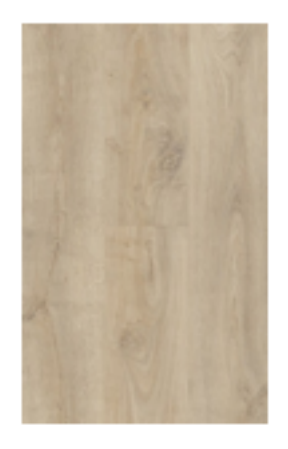
Nostalogic Oak Blonde