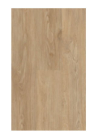
Nostalogic Oak Honey